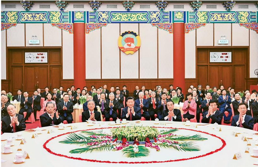
2021年12月31日，全国政协在北京举行新年茶话会。党和国家领导人习近平、李克强、汪洋、王沪宁、赵乐际、韩正、王岐山出席茶话会并观看演出。

实现中华民族伟大复兴的中国梦，需要广泛汇聚团结奋斗的正能量。要发挥人民政协作为实行新型政党制度重要政治形式和组织形式的作用，对各民主党派以本党派名义在政协发表意见、提出建议作出机制性安排。要健全同党外知识分子、非公有制经济人士、新的社会阶层人士的沟通联络机制。要全面贯彻党的民族政策和宗教政策，推动各民族交往交流交融，引导宗教与社会主义社会相适应。要全面准确贯彻“一国两制”、“港人治港”、“澳人治澳”、高度自治的方针，引导港澳委员支持特别行政区政府和行政长官依法施政，发展壮大爱国爱港爱澳力量。要坚持一个中国原则和“九二共识”，拓展同台湾岛内有关党派团体、社会组织、各界人士的交流交往，助推深化海峡两岸融合发展，