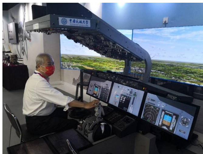
2021.9 C919 总设计师吴光辉院士调研仿真中心创新项目转化成果