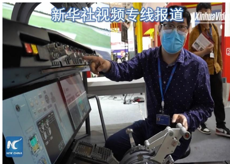
2021.5 新华社在世界智能大会期间对项目创新成果的报道