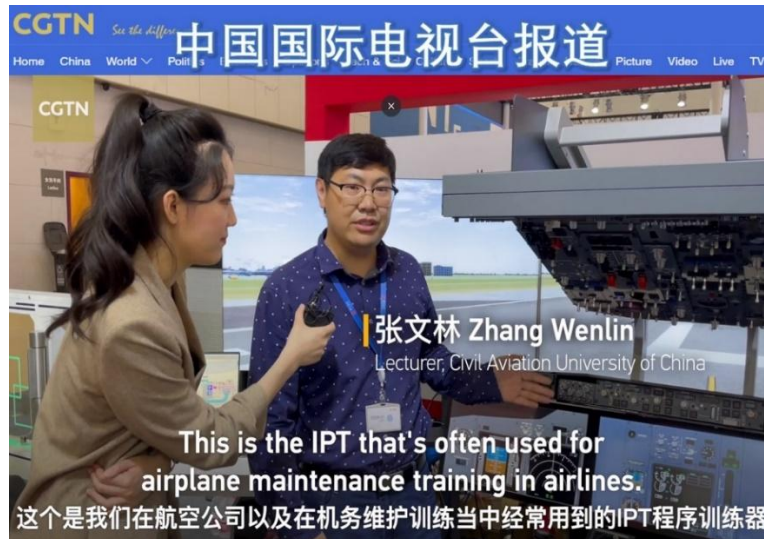
2021.5 中国国际电视台在世界智能大会期间对项目创新成果的报道