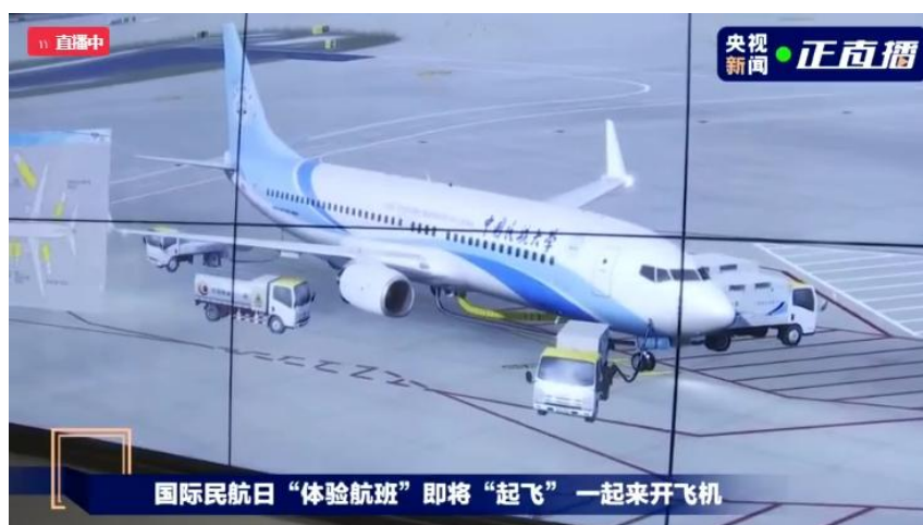
2021.12 中央广播电视总台走进中国民航大学国际民航日专题报道