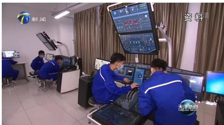
2021.9 天津新闻台报道机务维修工程仿真教学中心