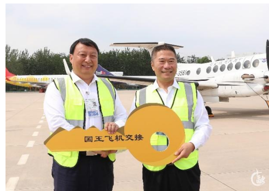
2021.8 国王 350 型飞机在中国民航大学停机坪完成交接