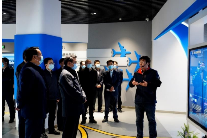
2021.9 中国民航局局长冯振霖深入仿真中心调研