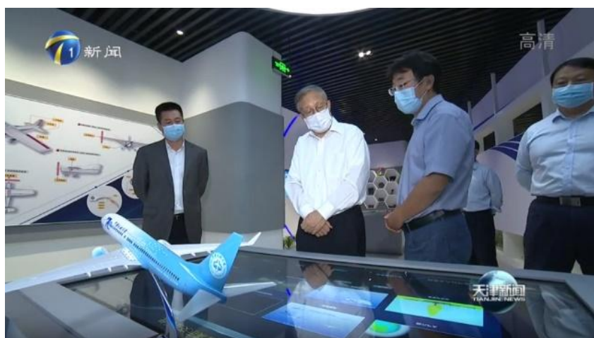
2021.9 天津市委书记李鸿忠深入仿真中心调研