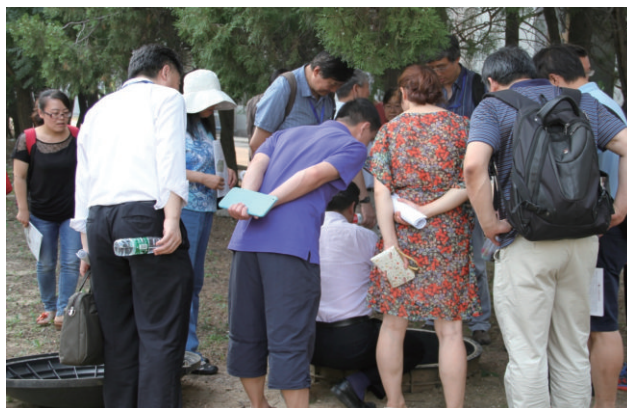
图6 流动地震仪就安装在这样的井里。数百个流动地震仪同时部署，组成了面向地球内部的“望远镜”阵列，通过地震波来研究地球内部的情况。所以地球物理学业内有个玩笑话：地震学家在野外干什么活？答，挖“坑”；地震学家在室内干什么活？答，量“数”

其中 p 是常数。因此，主震和余震，无论如何应该有一些物理上的差别。但问题是，迄今的地震学研究结果给出，主震和余震这两类遵从着完全不同的统计规律的地震，在前面所说的“地震参数”方面，还真看不出什么“像样的”差别。因此，近年来的一个新的想法是，既如此，是不是就不要再“纠结”一次地震究竟是主震还是余震的问题，而是在某种统一的“规则”的约束下，给出一次地震有多大的概率是一次独立事件。但另一方面，和“深震无毛”问题一样，“余震无毛”问题再次说明，我们关于地震震源的测量，