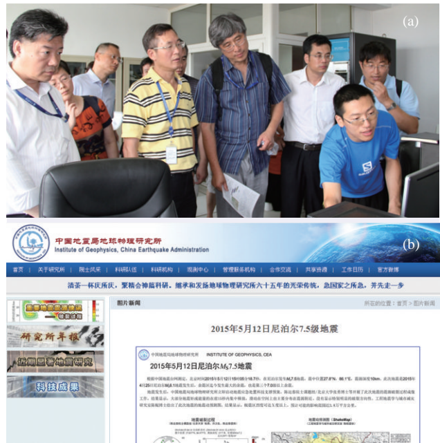
图2 (a)地震之后，利用传感器记录到、传输到数据中心的地震信号，地震部门可以很快地给出关于地震震源的描述，这些信息对减轻地震灾害十分重要

不错，从一个比较大的空间范围看，地震的过程就是，由板块构造运动提供能量，然后以某种方式通过地震释放掉这些能量。因此全球地震的分布是有规