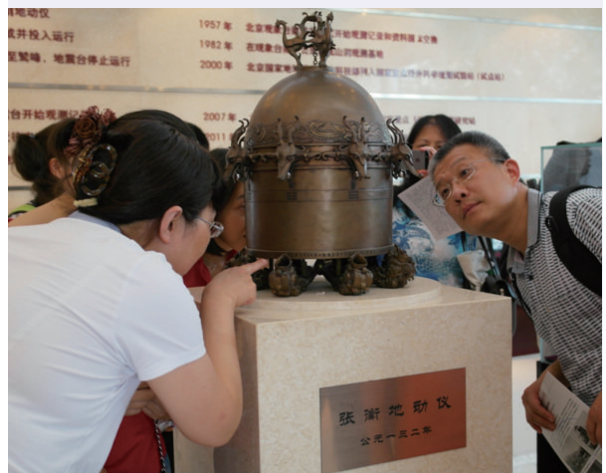
图5 地球物理学家的困难是,完全没有办法跑到地球的里面去,像这样直接地看它到底是怎么回事……