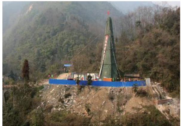
图3 2008年5月12日汶川8.0级大地震后,科学家在地震断层带上实施科学钻探,通过在断层带上采集岩心和随钻进行的各项物理测量,理解地震发生时在断层上究竟发生了什么。如图是在龙门山断裂带中北段实施的汶川科钻三号孔的现场作业情况

其中 B 是一个常数。这个标度律 (scaling law) 使一些物理学家提出,地震是否具有“自组织临界性”(self-organized criticality, SOC),而上述关系是一种“ 1/f 噪