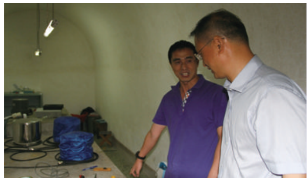
图1 这是在位于北京西郊白家疃的北京国家地球观测台(NEOBJI)的山洞里，可以说，这是地震台网的“触角”。在这个安静的山洞里，安放地震传感器，记录来自遥远的地震所辐射的穿过地球内部的地震波。您正在看的筒状的小东西(图中左下角)，就是三分量一体的宽频带地震传感器。地震观测对环境的要求很高，在山洞里放置传感器是一种办法，在深井里放置传感器是另一种方法

因此，一定意义上说，这里和物理学家谈的地震的问题，有点像黑洞的物理问题。在“弹性视界”外面的事情，就不麻烦物理学家了。但在“弹性视界”里面的事情，现在的知识并不多。所以第一次见面时我说“我是地震局地球物理研究所的——如果地震有物理的话”，大家都笑了。的确，如果看“弹性视界”之外的事情，那么地震不但有物理，而且做得不错，像现在大家知道的地震早期预警，核试验地震监测，