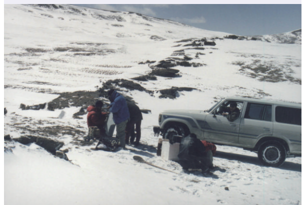
图4 2001年11月14日昆仑山口西8.1级大地震后,地震学家在地震断层带(如图中左上角线状的带所示,注意它并不是像教科书上画的那样是一条简单的直线)上通过观测断层带的“围陷波”来研究断层的“愈合”过程