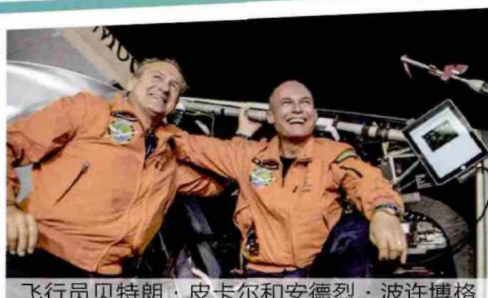
飞行员贝特朗·皮卡尔和安德烈·波许博格